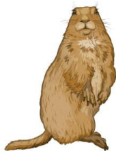
Chien de prairie 1